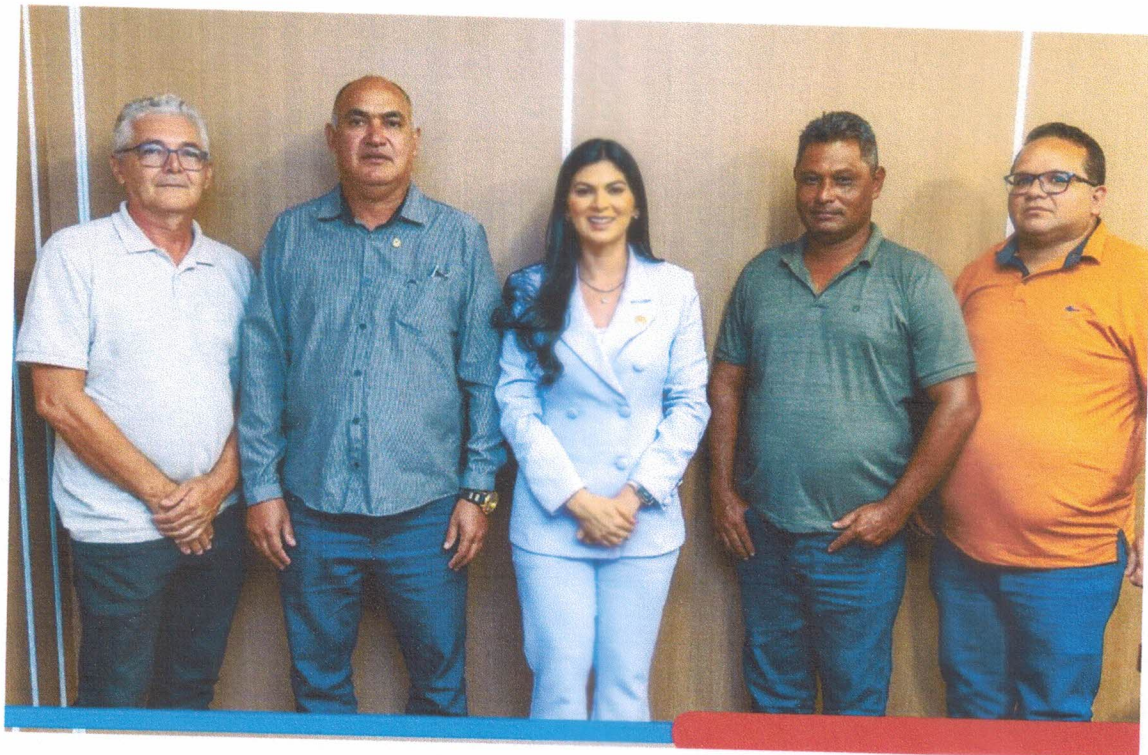
Gabinete da Deputada Estadual Diana Belo