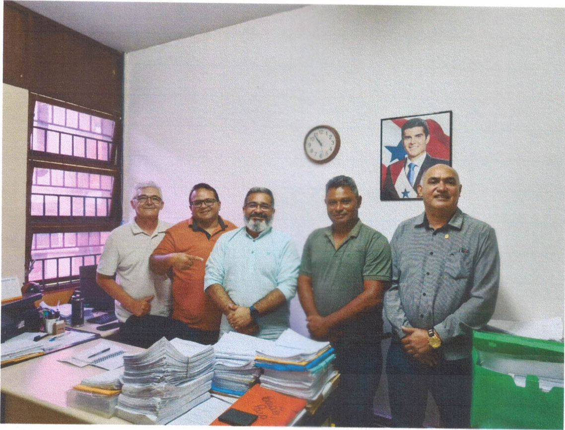
COHAB – Companhia de Habilitação do Estado do Pará